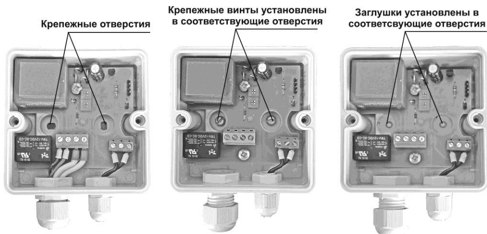
Рис 1. Монтаж прибора.

Прибор может использоваться и без крепежа, например, непосредственно на крыше здания. В этом случае установка заглушек так же необходима, в противном случае герметичность корпуса теряется. См. Рис.1