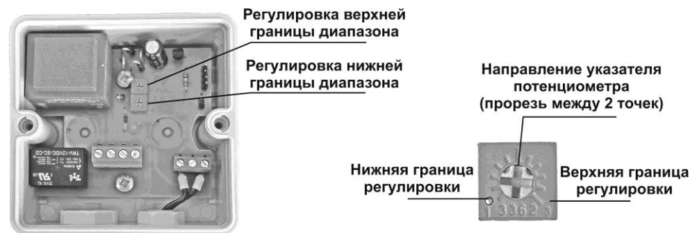
Рис. 2. Настройка границ регулировки температуры.

Установите на шкалах терморегулятора необходимые границы диапазона рабочей температуры и включите прибор в сеть. См. рис 2.