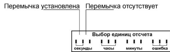
Рис. 2 Выбор единиц отсчета времени.